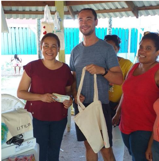
Fotos 11, 12 y 13: Socialización del proyecto “Tejiendo Sueños con la Red de Mujeres de Utila”