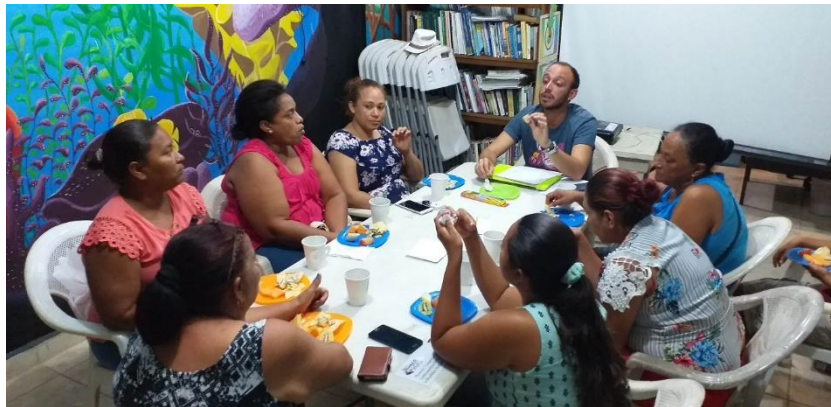
Foto2: Taller sobre “Autoestima” y Taller de “Conformación de grupos” con las mujeres.

1 taller de formación de equipos de trabajo, impartido por Javier Segovia y Suriel Dueñas.