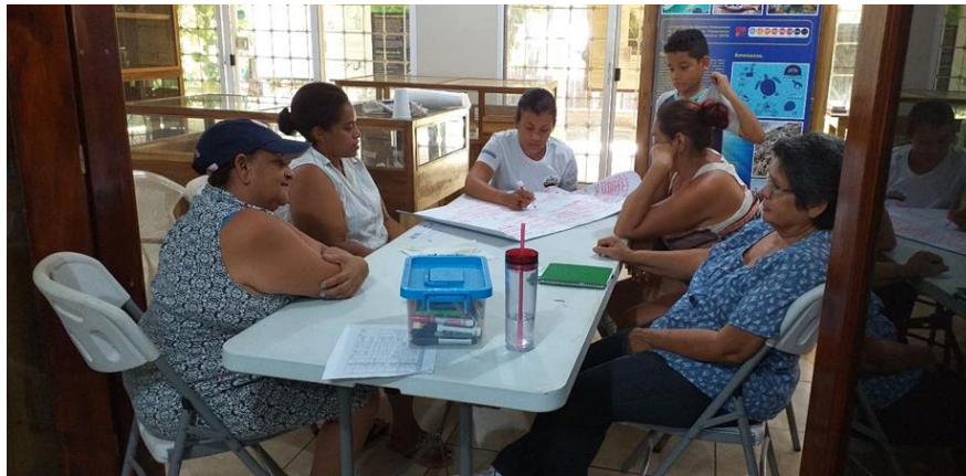
Foto1: Realizando lluvia de ideas para la matriz FODA con el grupo de mujeres.

Anexo 1: FODA, grupo de mujeres artesanas.